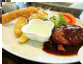
人気のバーリイランチ 1280円

お料理は、どれも素材から調理まで、シェフのこだわりと技巧が光る逸品(^^)手作りケーキ等デザートも充実していますので喫茶感覚で女子会もできます♪