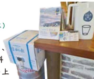
南紀白浜の銘水「富田の水」も試飲できるよ♪

安全で良質で旨みがあり、ビールを仕込む際に、原料本来の風味を邪魔しない上に、より味と香りを引き出してくれるこのナチュラルミネラルウォーターを仕込み水として使用しています。